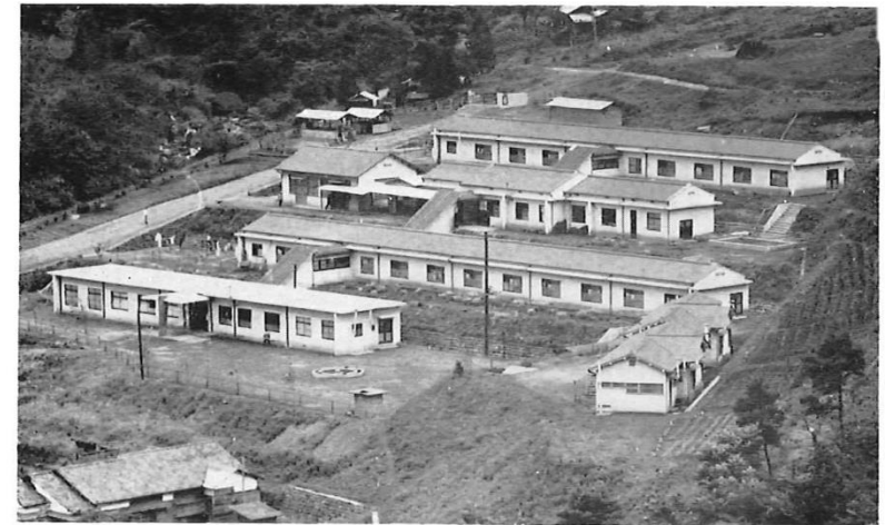
宝 山 寮 の 全 景

被保険世帯数 4,348 被保険者数 19,526 保 險 税 21,594千円 医 療 費 58,880 "