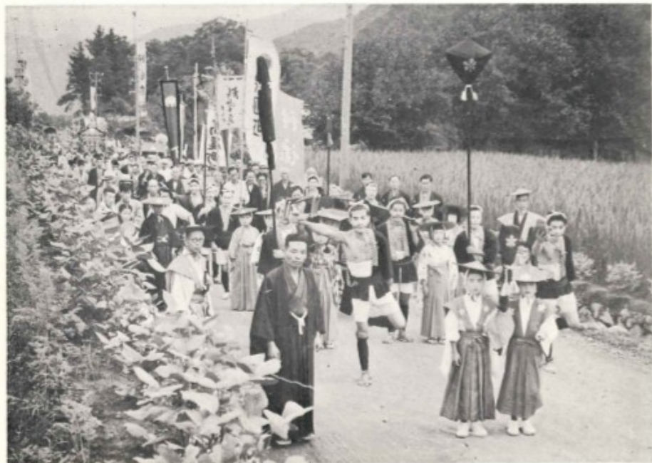
八潮祭の大名行列