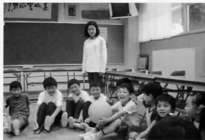
仲良しルンルンウィーク集会

約二週間に渡って交代で各縦割り班ごとに休み時間に遊びました。六年生がみんな楽しんでような企画を考えて楽しい一時を過ごすことができました。