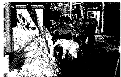
ご協力ありがとうございました

住みよい環境を守るため、家庭廃棄物は指定のごみ収集日に、河川・水路に投棄しないようにしましょう。