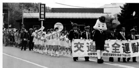
昨年の交通安全パレード