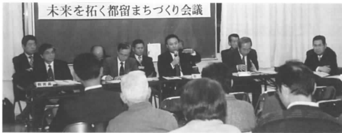
未来を拓く都留まちづくり会議の様子(市町村合併について)