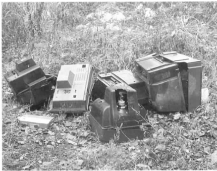
不法投棄されたテレビ