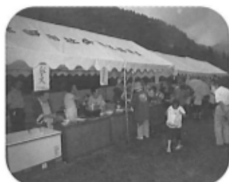
賑わいをみせる「ゆうゆう広場」