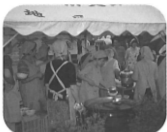
ふるさと自慢づくり郷土料理グランプリ「アオハタうどん」試食会