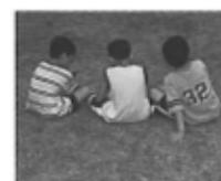
探検後のひととき