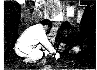
きのこ教室の様子

日時 3月25日(日) 午前10時～午後2時 場所 宝の山ふれあいの里 コテージ管理棟 講師 大月林務事務所 林業振興課職員 定員 30名(要申込) 持ち物 お弁当、ビニール袋、きのこの菌と仲良くなる気持ち 申込先 宝の山ふれあいの里 ネイチャーセンター ☎(45)6222