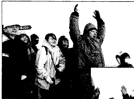
初日に向かって、 参加者全員で万歳三唱