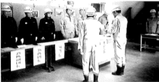
昨年の訓練の様子