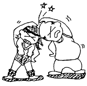
(レオタードでなくてもいいですよ!)