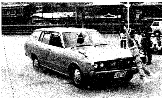
禾一小で行なった人形をつかったの実験

ブドウ狩りや紅葉狩り、はたまたキノコ狩りと、秋は行楽に車を使う機会が多くなります。ところで、無理な計画やドライバーの疲労がもつて、思わぬ事故を引き起こしたのでは、楽しいはずの家族旅行も、一瞬のうちに台なしになってしまいます。行楽シーズンの自動車事故は、その多くがドライバーの疲労・居眠り運転が原因で起きています。くれぐれも注意しましょう。