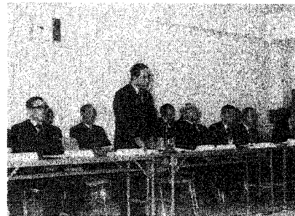
質問に答える高部市長