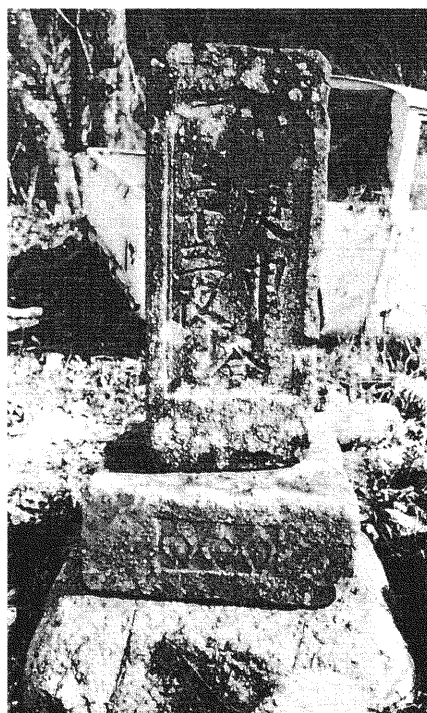
228 庚申塔 二十三夜塔

所在地 都留市鹿留古渡門瀬 碑形 角柱状文字碑 台石三猿 年号 明和二歳酉六月吉日 (一七六五年) サイズ 碑身 25 × 29 × 74 cm 彫銘