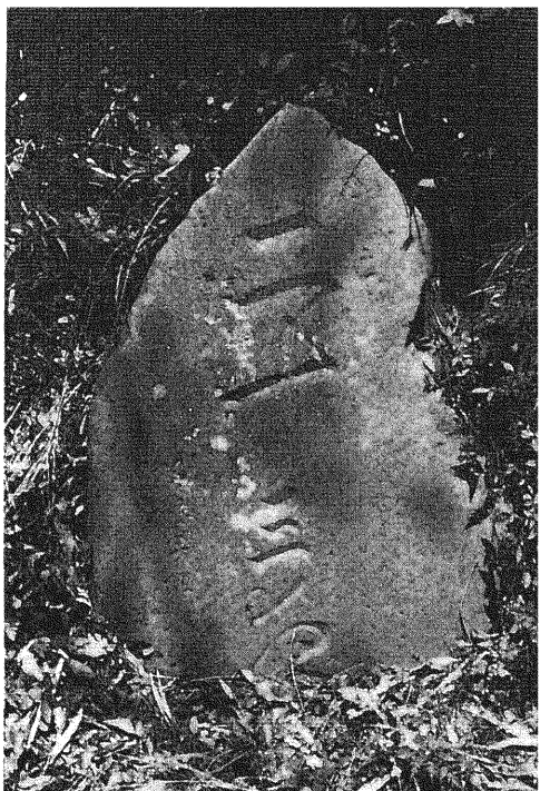
222 二十三夜塔 所在地 都留市下谷(羽根子) 碑形 自然石文字碑 年号 明治二十五年二月(一八九二年) サイズ 碑身 25×70×95cm 彫銘 二十三夜 明治二十五年二月基 羽根子組講中