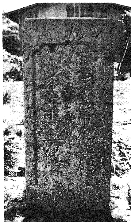
229 庚申塔 二十三夜塔

所在地 都留市鹿留沖田屋 碑形 角柱状文字碑 花崗岩 年号 明和九年十月大吉日 (一七七二年) サイズ 碑身 25 × 35 × 71 cm 彫銘 明和九年十月大吉日 壬辰