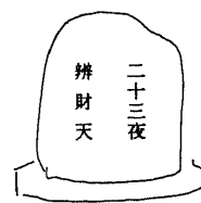
232 二十三夜塔辨財天 所在地 都留市法能田代 碑形 自然石文字碑 サイズ 碑身 15×54×78 cm 彫銘