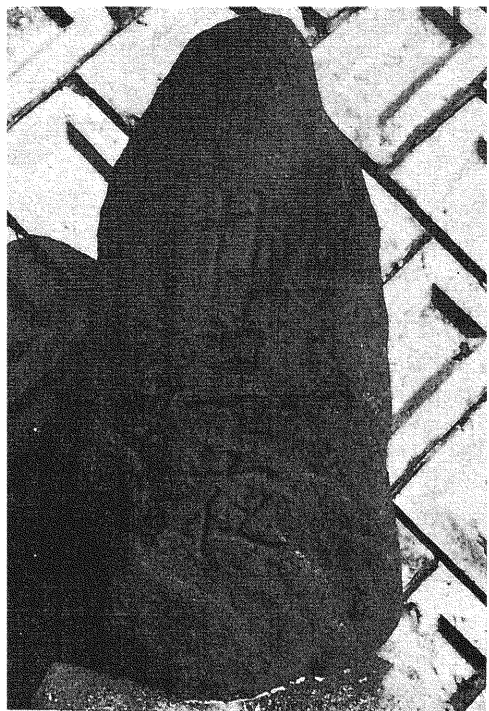
223 二十三夜塔 所在地 都留市上戸沢 碑形 自然石文字碑 年号 大正三年三月吉日(一九一四年) サイズ 碑身 21×44×87cm 彫銘 廿三夜 講中 大正三年三月吉日