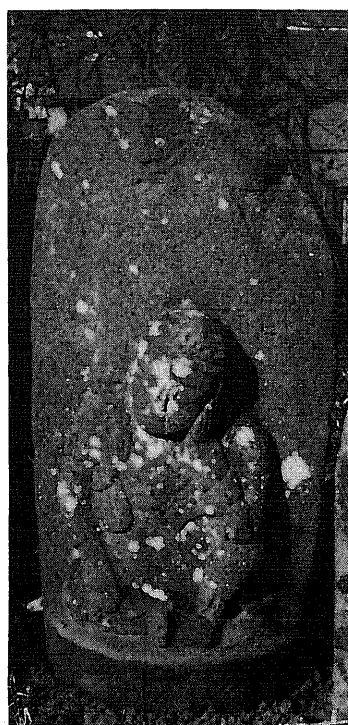
361 庚申塔 所在地 都留市法能宮原東光寺 形 舟形光背浮彫座像 碑 碑身 14×28×55 cm 坐身 30 cm サイズ 仏面 11×9 cm 肩幅 20 cm