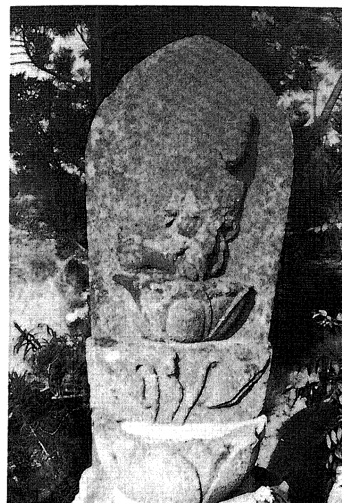
365 庚申塔 所在地 都留市境 所有者 広徳院 碑形 舟形光背浮彫座像蓮台 サイズ 坐身 35 cm 仏面 6 × 5 cm 坐幅 23 cm 台石 37 × 37 × 18 cm