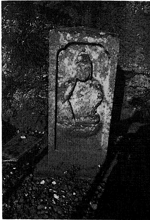
357 庚申塔 所在地 都留市四日市場生出山表向 所有者 清泉寺 碑形 山状角柱浮彫立像 年号 明和六年六月十八日 (一七六九年) サイズ 碑身 31 × 31 × 74 cm 坐身 36 cm 仏面 8 × 9 cm 坐幅 16 cm 肩幅 17 cm 彫銘 靈 婦真夏丘少妙貴信女 位 明和六年 丙戌 六月十八日