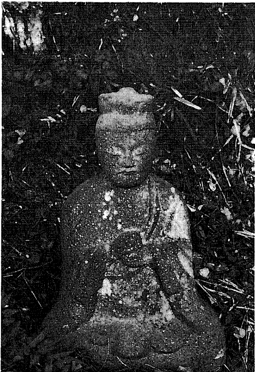
360 庚申塔 所在地 都留市中津森 碑形 単身丸彫座像 サイズ 坐身 35 cm 坐幅 33 cm 肩幅 23 cm 彫銘 問禪子應 大日如来 如来應住正扁知明 行足善逝也