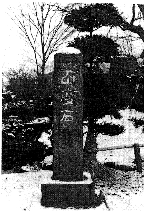
366 庚申塔 所在地 都留市上谷四丁目 所有者 普門寺 碑形 山状角柱文字碑 サイズ 碑身 30 × 31 × 142 cm 彫銘 祭庚申碑