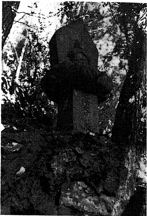
358 庚申塔 所在地 都留市大幡広教寺 碑形 舟形光背浮彫座像 年号 慶応二年 (一八六六年) サイズ 碑身 14 × 39 × 55 cm 立身 33 cm 仏面 5 × 7 cm 坐幅 24 cm 肩幅 10 cm 彫銘 當寺 十九主 慶応二丙寅中秋