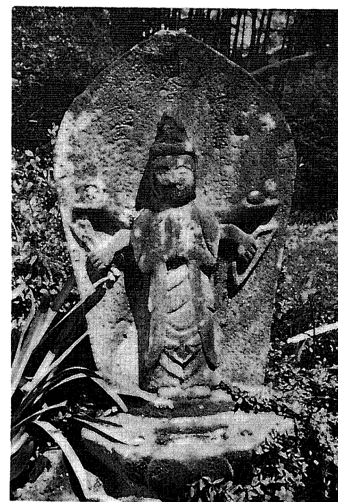
364 庚申塔 所在地 都留市十日市場 所有者 永寿院 碑形 舟形光背浮彫立像蓮台 サイズ 碑身 39 × 39 × 62 cm 立身 46 cm 仏面 14 × 8 cm 坐幅 34 cm 銘 源室□本上座 同会 視室妙林信女