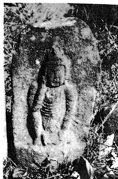
362 庚申塔 所在地 都留市金井坐禅岩 形 舟形光背浮彫座像 碑 碑身 15×30×53 cm 坐身 34 cm サイズ 仏面 8×7 cm 肩幅 15 cm