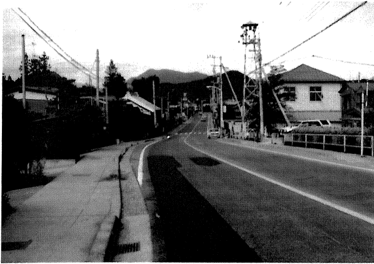
国道139号線と十日市場の家並

人家は、この両川河間の中央部、谷村から桂川を渡って夏狩村に抜ける道沿いに描かれている。昭和五十五年の国勢調査による世帯数六五八、人口は二二六二うち男一〇五六・女一〇六で、現在も主として河間に人家は集中している。さてこの道は、現国道一三九号線にあたるが、絵図とはルートに大きなズレがある。これは桂川に架設される佐伯橋（斉木橋）の位置とも関わり、『甲