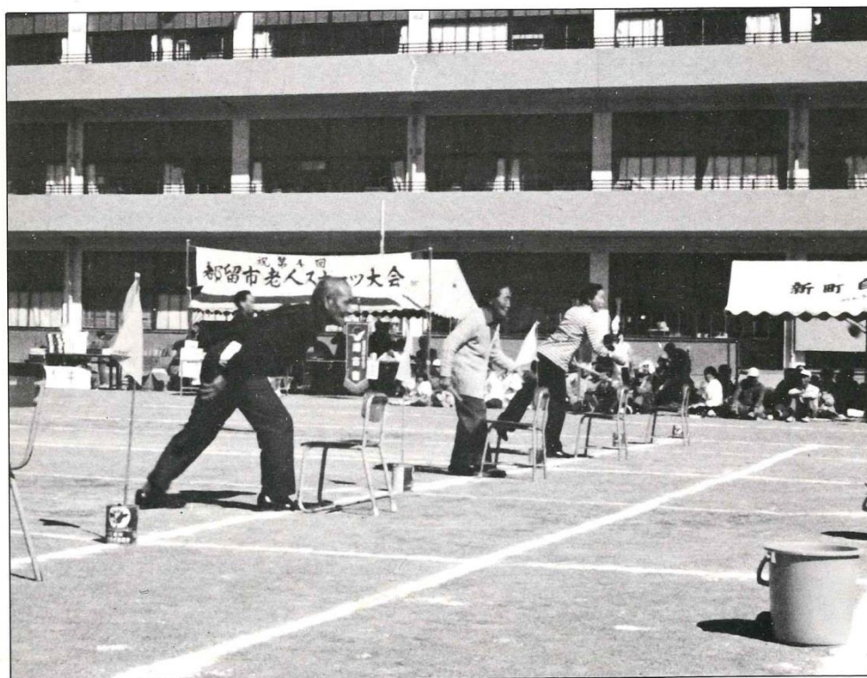
老人スポーツ大会