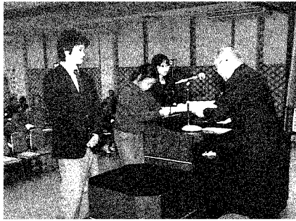
青少年健全育成標語入賞者表彰

この中から厳正な審査を行い、標語では優秀作品四点、佳作八点が、また作文では市長賞ほか入選作品一五点が選ばれ、十一月五日の「都留市青少年健全育成推進大会」で表彰されました。