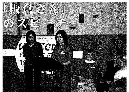
「板倉さん」のスピーチ

さらに三年に一度、短期留学生を二十名から三十名、半月程度留学させており、今や長期留学と合わせ、生徒たちにとっては興味深い事業の一つとなっています。