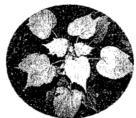
成長が早いケナフ

いつも、帰って来たり、来なかったりと気まぐれなので、あまり心配はしていませんが…。