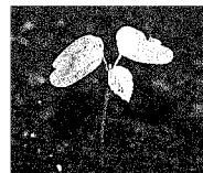
ケナフの 発芽 →