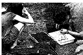
ケナフの 植え付け

ケナフという植物を知っていますか？ケナフは、熱帯地方では6カ月で3~4mにも生長する草です。最近では、木材パルプにかわる紙の原料として注目されています。木の乱伐採の減少につながることから、センターでは6月からこのケナフの試験栽培をはじめています。