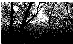
富士山も見えるよ