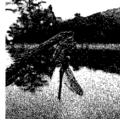
クロスジギ ンヤンマ