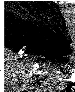
新しい発見があるかもよ