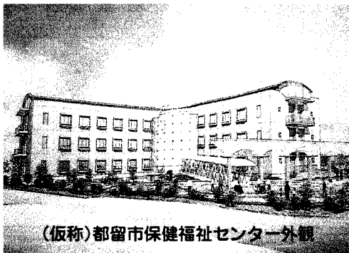
(仮称)都留市保健福祉センター外観