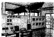
センター内の 展示の様子

宝鉦山の歴史の資料や貴重なお話、コウモリが家にすんでいるよなどのたくさんの情報を次世代にのこしていきたいと活動をすすめています。ご協力おねがいします。