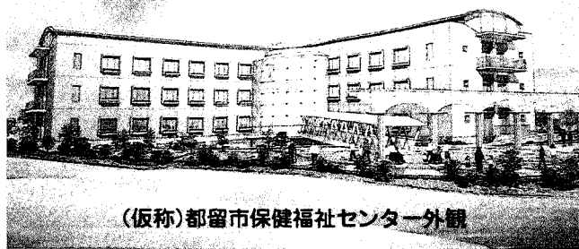
(仮称)都留市保健福祉センター外観

下谷地内に建設を進めています(仮称)都留市保健福祉センターは、来年一月の完成を目指して順調に工事が進んでいます。