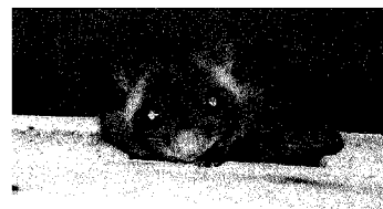
こんなかわいらしいムササビが見られるよ