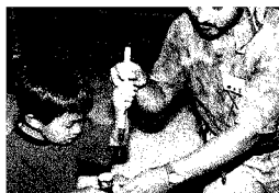
左:竹細工に挑戦 右:ヤマアカガエル