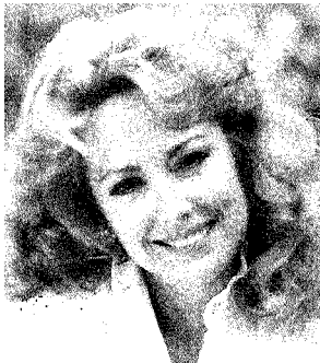
メラニー・ホリテイ

名だたる有名ホールで引っ張りだこの人気ソプラノ歌手! 5/17(日) メラニー・ホリテイ&ウィーン・ヒーダーマイヤーソリスト