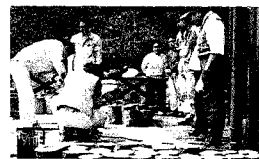
きのこのほだ木づくり

日時 3月14日(日)午前10時～午後2時 場所 都留いきものふれあいの里 ネイチャーセンター 定員 30名(定員になり次第締め切り) 講師 大月林務事務所職員 産業観光課 農政担当職員