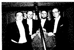
ウィーン・ ビーダーマイヤーゾリステン

ニューイヤーコンサートの定番。東京芸術劇場、紀尾井ホールなど、名だたるホールでひっぱりだこのソプラノ歌手。その美しい容貌もさることながら、歌い、演じ、踊れる真のエンターテイナーとして絶賛されています。得意とするオペレッタの名曲やお馴染みのミュージカルの名曲が次から次へと演奏されます。