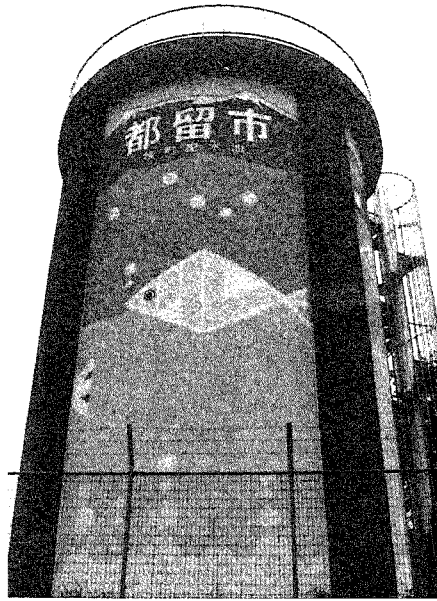
中央道（上り車線）から良く見えます

桂町配水池（PCタンク）は、二七〇立方メートルの配水池で桂町市内の約四六〇世帯一七〇〇人の皆さんに給水をしています。