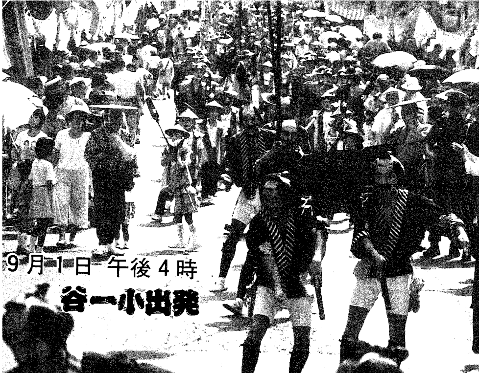
9月1日 午後4時 谷一小出発