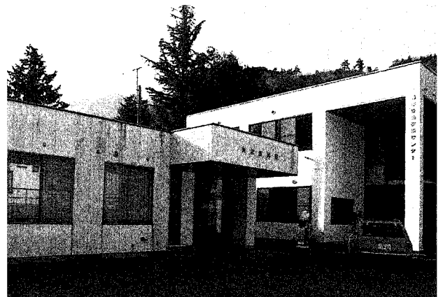
盛里地域コミュニティセンター