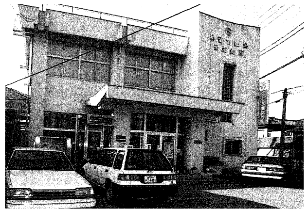
禾生地地域コミュニティセンター