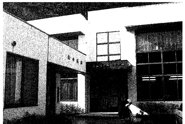
宝地域コミュニティセンター