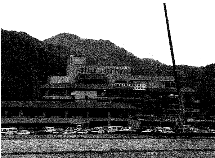
完成間近の市立病院・老人保健施設

市立病院設置の意義が、市民に適切な医療機会を提供することにあり、公設民営方式による管理委託での運営は、公共性と経済性のとれた医療を行う上で最良の方法であると考え、医療整備審議会