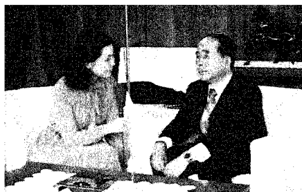
▲ アナウンサーよりインタビューされる市長