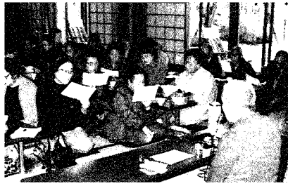
↑ 趣味のグループ活動の民謡の会