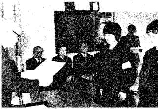
市内中学校で行なわれた表彰式のもの

考えるに、すべての人々がよりいっそう、お互いの人権を尊重し合って、よりよい生活がおくれるようになれば、本当によいことだと思えます。やはり、みんなが、この人権について、もっと詳しく考えてみるべきだと思えます。人権について、みんなが十分理解してこそ真の意味の正しい社会生活が築かれると思うからです。